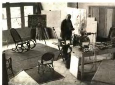
Ο Νίκος Χατζικυριάκος Γκίκας στο ατελιέ του στην Υδρα, 1960

Α πό τις 7 Ιουνίου στο κεντρικό κτήριο του Μουσείου Μπενάκη παρουσιάζεται μια συναρπαστική ανασκόπηση της ζωής και του έργου τριών σημαντικών προσωπικοτήτων της τέχνης και των γραμμάτων του 20ού αιώνα: του Νίκου Χατζικυριάκου-Γκίκας, του Τζον Κράξτον και του Πάτρικ Λι Φέρμφορ. Η έκθεση διερευνά τη φιλία που τους ένωσε για σχεδόν μισό αιώνα, καθώς και την αγάπη που μοιράζονταν για την Ελλάδα και τον ελληνικό κόσμο. Η έκθεση με τίτλο «Γκίκας, Craxton, Leigh Fermor: Η γοητεία της ζωής στην Ελλάδα» αντανάκλα μέσα από τα κείμενα του Λι Φέρμφορ και το ζωγραφικό έργο του Γκίκας και του Κράξτον τις μαγευτικές τους εξερευνητικές κατά τη διάρκεια της ζωής τους, με πηγές έμπνευσης γοητευτικές περιοχές της Ελλάδας όπως η Υδρα, η Καρδαμύλη, η Κρήτη και η Κέρκυρα. Μια επισκόπηση τόσο της προσωπικότητας και του αλληλένδετου έργου τους όσο και των όψεων της Ελλάδας κατά τη διάρκεια της ζωής τους παρουσιάζεται σε μια έκθεση-αφιέρωμα στους τρεις