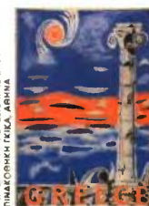
Nikos Chatzikiyriakos-Gikas. Προσχέδιο αφίσας, 1948. Τέμπερα σε χαρτόνι, 100,5x70,5 εκ.