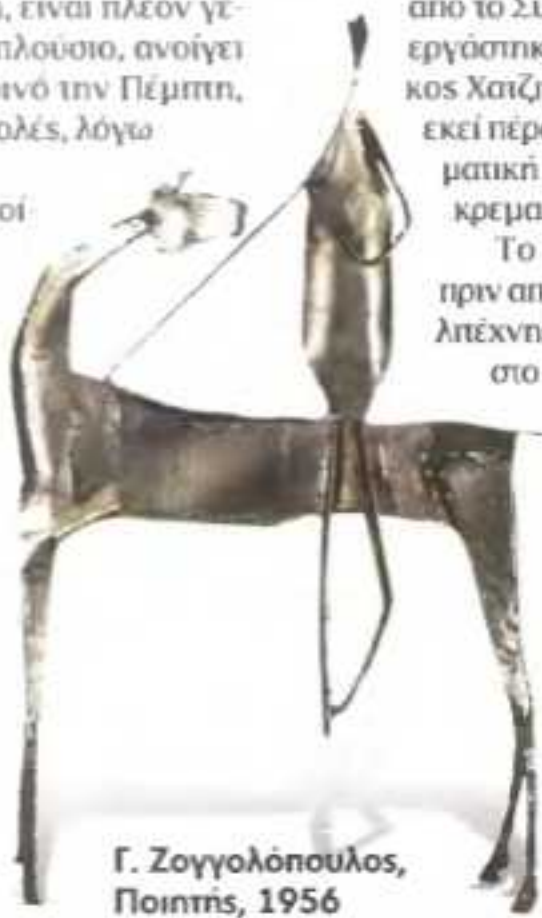
Γ. Ζογγολόπουλος, Ποιητής, 1956

Το 1989, τέσσερα χρόνια πριν από τον θάνατό του, ο καλλιτέχνης κληροδότησε το κτίριο στο Μουσείο Μπενάκη, μαζί με το περιεχόμενο του εργαστηρίου και της κατοικίας του, τα οποία ανέπαφα περιλαμβάνονται στο σημερινό μουσείο, στον τέταρτο και τον πέμπτο όροφο, ενώ στον μισό τρίτο όροφο παρουσιάζονται έργα του ζωγράφου. Η ανάπλαση του οικοδομήματος ξεκίνησε από τον αρ-