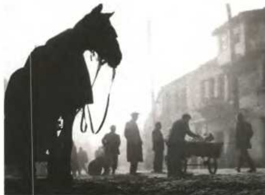
Κ. Μπαλάφας, Παζάρι. Γιάννενα, 1957