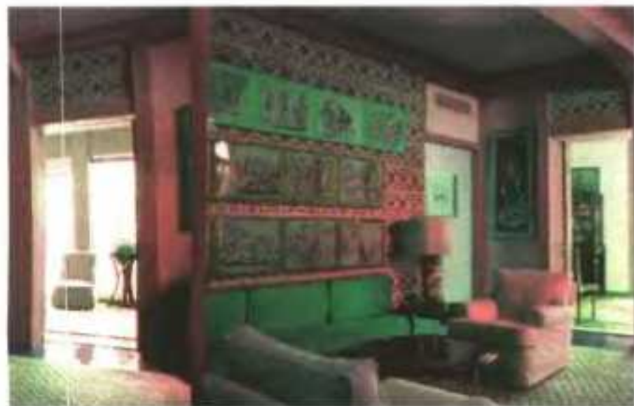
Αποψη από το σαλόνι του Ν. Χατζηκυριάκου - Γκίκα στον 4ο όροφο, με σχέδιά του από το ταξίδι του στην Ινδία