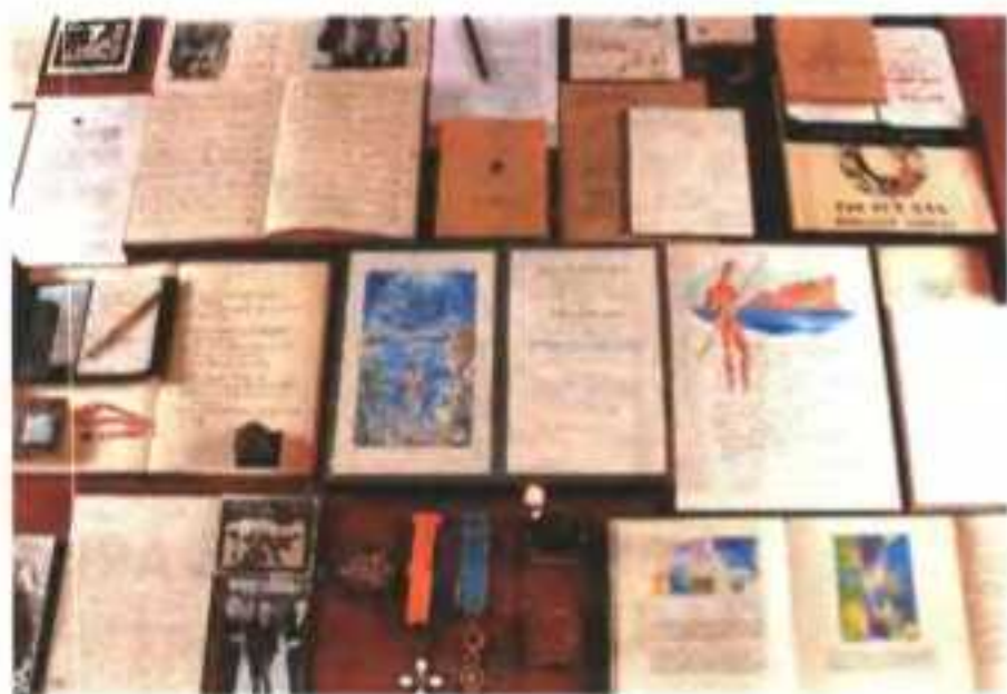
Η προθήκη με εκδόσεις και χειρόγραφα του Οδυσσέα Ελύτη (διακρίνεται το Νόμπελ) και του Νίκου Γκάτσου