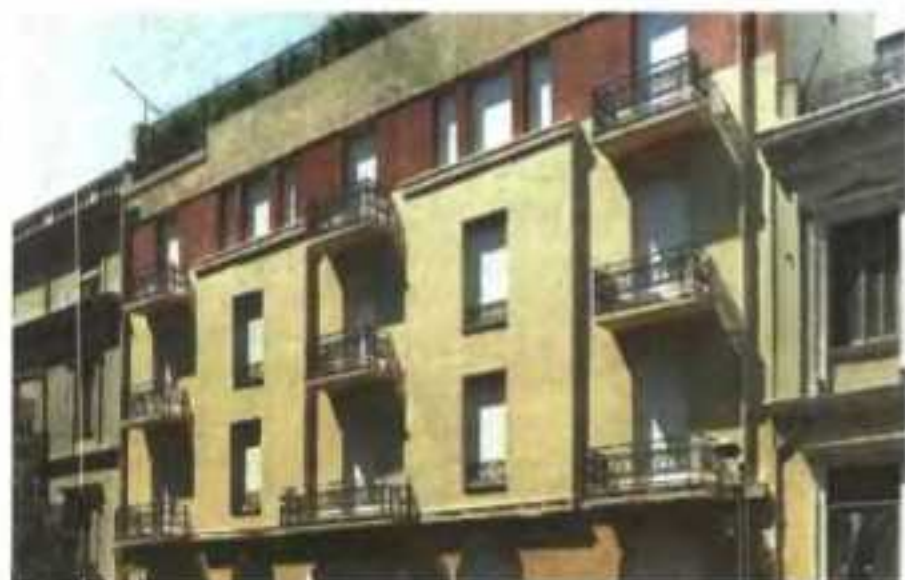
Το κτίριο της οδού Κριεζώτου 3, κληροδοτημένο στο Μουσείο Μπενάκη από τον ζωγράφο Νίκο Χατζηκυριάκου - Γκίκα