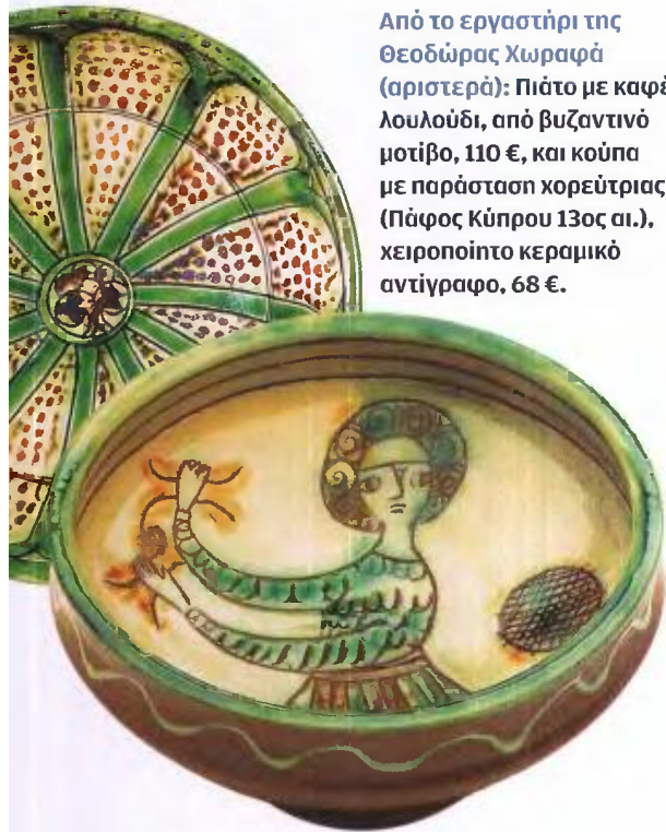
Από το εργαστήρι της Θεοδώρας Χωραφά (αριστερά): Πιάτο με καφέ λουλούδι, από βυζαντινό μοτίβο, 110 €, και κούπα με παράσταση χορεύτριας (Πάφος Κύπρου 13ος αι.), χειροποίητο κεραμικό αντίγραφο, 68 €.

νημα της Δέσποινας Γερουλάνου τούς ξάφνιασε ευχάριστα. Ένας μαγνητικός μαυροπίνακας σε σχήμα ταύρου, εμπνευσμένος από σχέδιο του Νίκου Χατζηκυριάκου-Γκίκα, είναι από τα πιο χαρακτηριστικά κομμάτια του πωλητηρίου της Κριεζώτου. Η στήριξη ενός τόσο μεγάλου φορέα τούς είναι πολύτιμη. «Δεν μας ενδιαφέρουν οι πωλήσεις», λένε. «Φτάνει που έργα μας υπάρχουν εκεί. Για κάθε νέο δημιουργό, η αξία ενός “συμμάχου” όπως το Μουσείο Μπενάκη είναι ανυπολόγιστη...» •