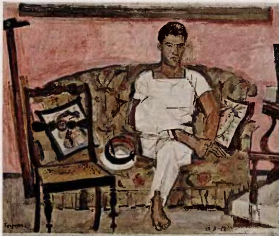
Ναύτης Ξυπόλυτος στον καναπέ, 1962. Λάδι σε πανί λινό, 41x50,5 εκ. Κάτω, το ίδιο έργο σε προσχέδιο. Μολύβι σε χαρτί, 26,5x37 εκ. Ίδρυμα Γιάννη Τσαρούχνη. Ο μεγάλος ζωγράφος δούλεψε ακούραστα πάνω στα θέματά του επί σειρά ετών.