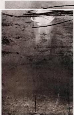
Τα έργα του έχουν φωτεινό και σκοτεινό διαστήματα, με περιορισμένη χρωματική παλέτα και εξαιρετιστικό ύψος. Η φιγούρα είναι απουσία τις περισσότερες φορές.

Ξαναγυρίζουμε στη ζωγραφική του. Τι είναι το φως στη δύσκολη εποχή που ζούμε; «Κάθε φορά είναι και κάτι διαφορετικό. Για μένα σήμερα είναι ένα καντηλάκι, η ελπίδα που πρέπει να κρατήσουμε ζωντανή. Δεν είναι φωταψία, είναι μια φλογίτσα. Όμως υπάρχει και μπορεί να μας ζεστάνει, αρκεί να την ανακαλύψουμε μέσα μας. Ορφείουμε να έχουμε έστω και την ψευδαισθησιονική μπορούμε να αλλάξουμε τα πράγματα, γιατί αλλιώς θα σταματούσαμε να προσπαθούμε». Εκείνος από πού αντλεί δύναμη; «Έγινε πατέρας πρόφατα και η ύπαρξη του γιου μου με γεμίζει δύναμη. Πείρνω κουράγιο από το φως της Τήνου, το τοπίο, τους ανθρώπους που αγαπώ και μοιράζομαι τη ζωή μου. Όλοι έχουμε προβλήματα, ο βαθμός σοβαρότητας διαφέρει. Δεν χρειαζόμαστε πολλά. Η ποιότητα των συναισθημάτων αρκεί...».