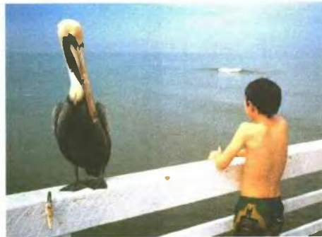
Αγόρι με πελεκάνο, Ντεϊτόνα Μπις, Φλόριδα, ΗΠΑ, 1998