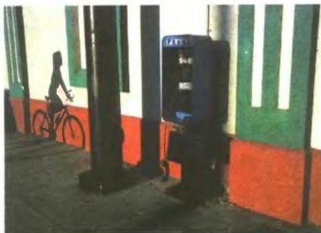
Δημόσιο τηλέφωνο, Ντεϊτόνα Μπις, Φλόριδα, ΗΠΑ, 1997

Η έκθεση «Κωνσταντίνος Μάνος - A Greek Portfolio, 50 χρόνια μετά» στο Μουσείο Μπενάκη (Κουμπάρη 1) έως 25 Αυγούστου. Η έκθεση «American Color» στο Athens House of Photography (Κεραμείον και Ελευσινίων), έως τέλος Αυγούστου.