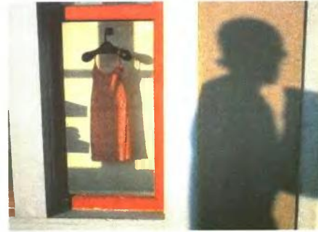
Φόρεμα σε πλαίσιο, Νέα Ορλεάνη, ΗΠΑ, 2000