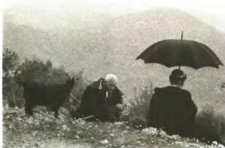
Βοσκόι με τη γίδα τους, ορεινή Κρήτη, δεκαετία του '60