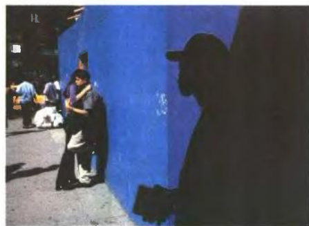
Σοκάκι στο downtown της Νέας Υόρκης, 2001

Λάτρης της αναλογικής φωτογραφίας, όταν δεν είχε σκοτεινό θάλαμο, τύπωνε τις φωτογραφίες