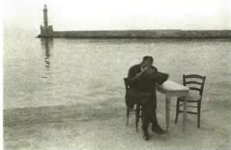
Διαβάζοντας εφημερίδα στα Χανιά, δεκαετία του '60