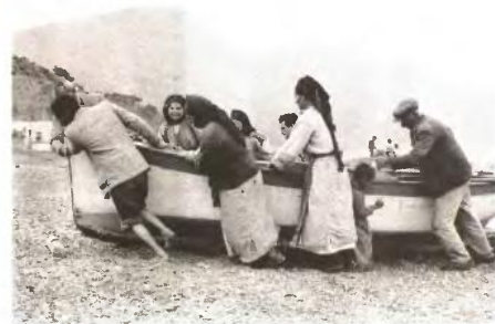
Τραβώντας μια ψαρόβαρκα στην Κάρπαθο, δεκαετία του '60

«Να μην ξεχαστεί η παλιά έννοια του χωριού», τονίζει ο κορυφαίος ελληνοαμερικανός φωτογράφος του πρακτορείου Μάγκνουμ στη συνέντευξη που μας παραχώρησε με αφορμή τις δύο εκθέσεις του στη χώρα μας