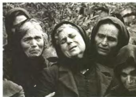
Μοιρολόγισσες, Πύργος Διρού, Μάνη, δεκαετία του '60