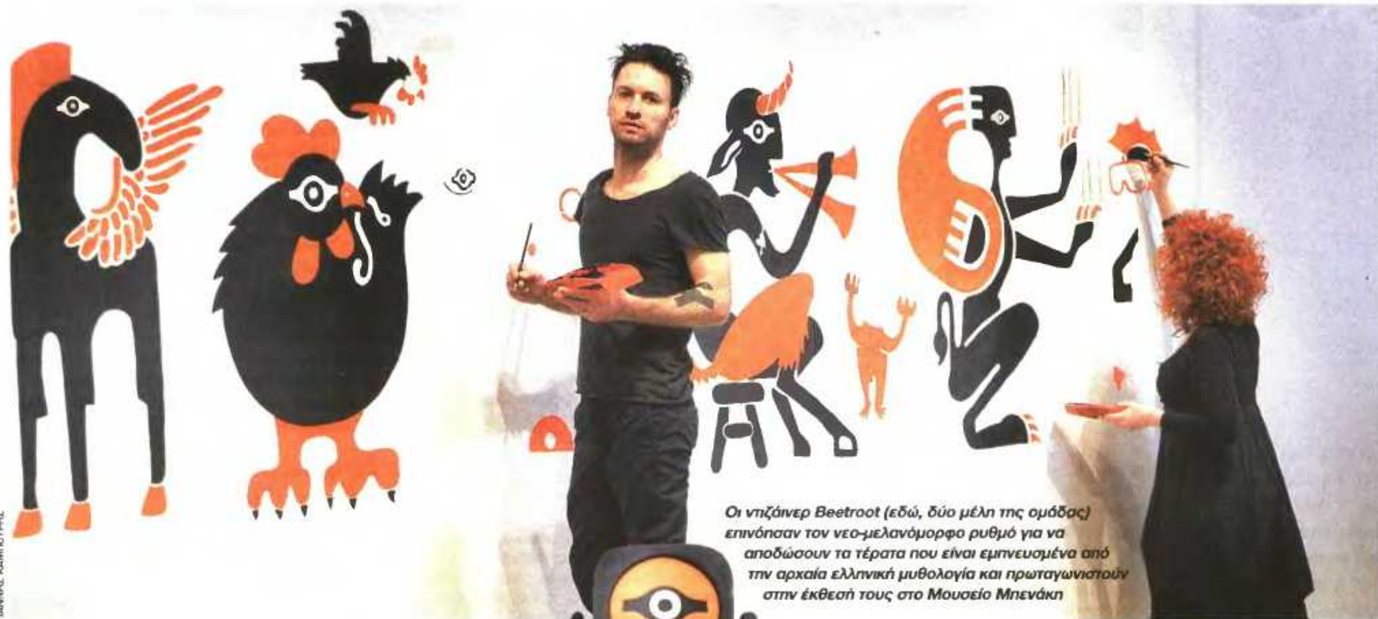
Οι ντζάινερ Beetroot (εδώ, δύο μέλη της ομάδας) επιτόησαν τον νεο-μελανόμορφο ρυθμό για να αποδώσουν τα τέρατα που είναι εμπνευσμένα από την αρχαία ελληνική μυθολογία και πρωταγωνιστούν στην έκθεσή τους στο Μουσείο Μπενάκη