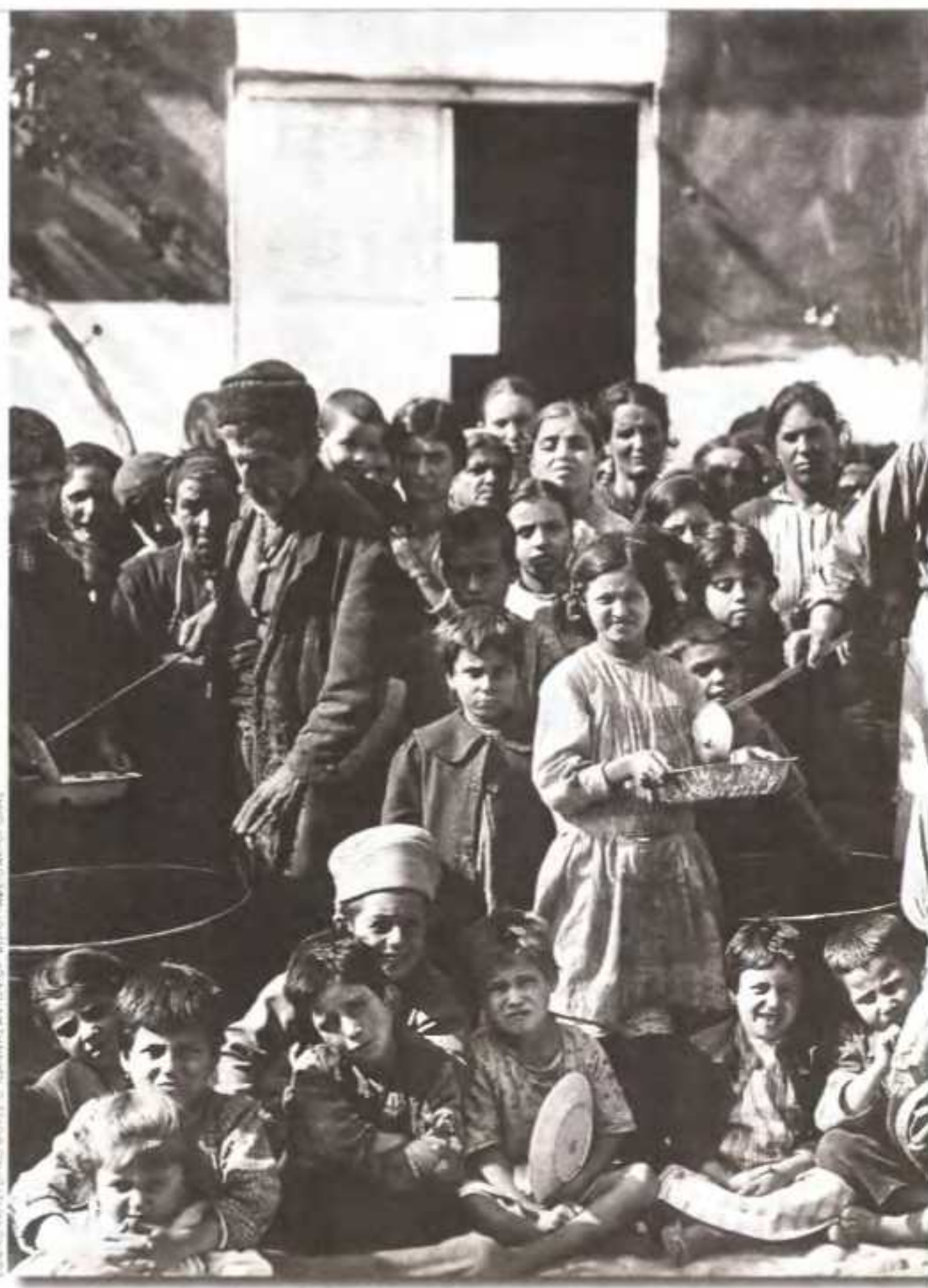
Σισσίτιο Ελλήνων που εκδιώχθηκαν από τη Μικρά Ασία, στη Μυτιλήνη, 1913-1914

Το ντοκυμαντέρ και η έκθεση 90 φωτογραφιών έχουν την ίδια δομή: διαρθρώνονται σε τρεις ενότητες και έναν επίλογο. Η πρώτη, με τίτλο «Η διάσπαση της Οθωμανικής Αυτοκρατορίας 1912-22», αναφέρεται στο τι οδήγησε στην ανταλλαγή, η δεύτερη με τίτλο «Διωγμός των Ελλήνων και ανταλλαγή πληθυσμών (Τουρκία και Ελλάδα 1922-24)» αναφέρεται στην άφιξη των προσφύγων στην Ελλάδα και στην ανταλλαγή, η τρίτη με τίτλο «Μια νέα πατρίδα» αναφέρεται στις νέες πατρίδες και ο επίλογος με τίτλο «Διασχίζοντας το Αιγαίο» αναφέρεται