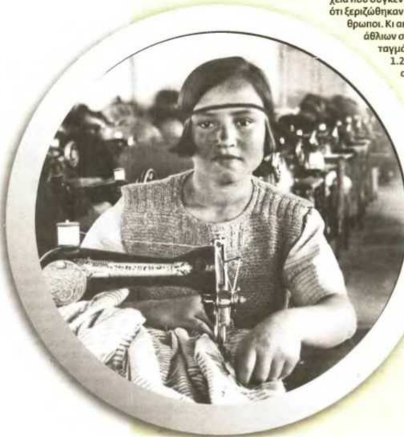
Ορφανή Μικρασιάτισσα μετά τον Διωγμό σε ορφανοτροφείο της Σύρου, 1922