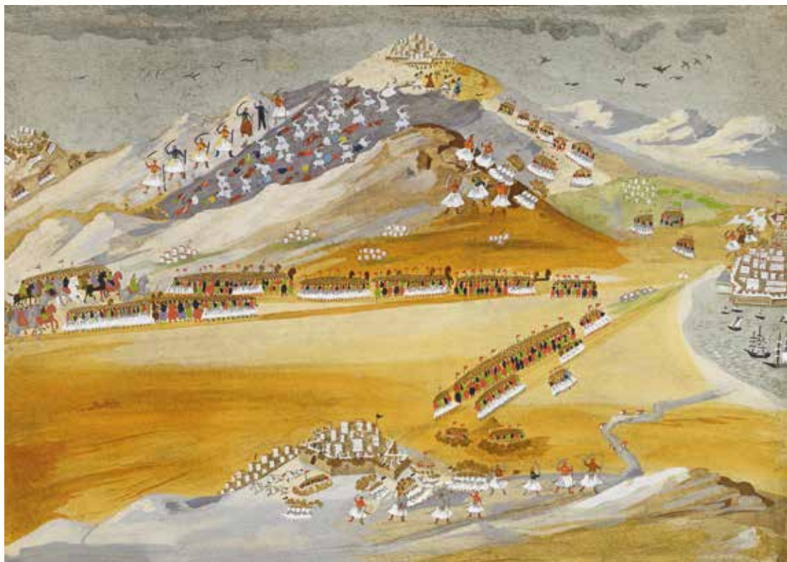
Παναγιώτης Ζωγράφος (1790-μετά το 1840 ή 1843) ◊ Η καταστροφή του Δράμαλη στα Δερβενάκια (Ιούλιος 1822) ◊ 1926 ◊ Χρωμολιθογραφία (αναπαραγωγή έργου του Παναγιώτη Ζωγράφου), 35×54 εκ. ◊ Μουσείο Μπενάκη 29599

ΠΑΡΑΛΕΙΠΟΝΤΑΙ ΕΝΔΙΑΜΕΣΕΣ ΣΕΛΙΔΕΣ IN-BETWEEN PAGES ARE OMITTED