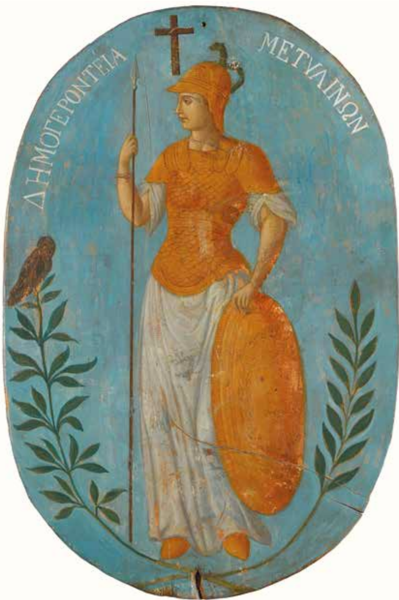
Θυρεός της Δημογεροντίας των Μετυλίων (Μυτιληνίων) ♦ Σάμος, 1820-1830 ♦ Λάδι σε ξύλο, 58x39 εκ. ♦ Μουσείο Μπενάκη 25866

Η κοινότητα των Μυτιληνίων, από τις μεγαλύτερες της Σάμου, πρωτοστάτησε μαζί με την κοινότητα του Βαθέος στην εξέγερση του νησιού, στις 14 Απριλίου 1821. Η προσωποποίηση της Ελλάδας με τα χαρακτηριστικά της θεάς Αθηνάς, η οποία παριστάνεται στον θυρεό, απαντά σε πλήθος αντικειμένων (σημαίες, σφραγίδες, παλάσκες κ.ά.) σχετικών με τον Αγώνα της Ανεξαρτησίας.