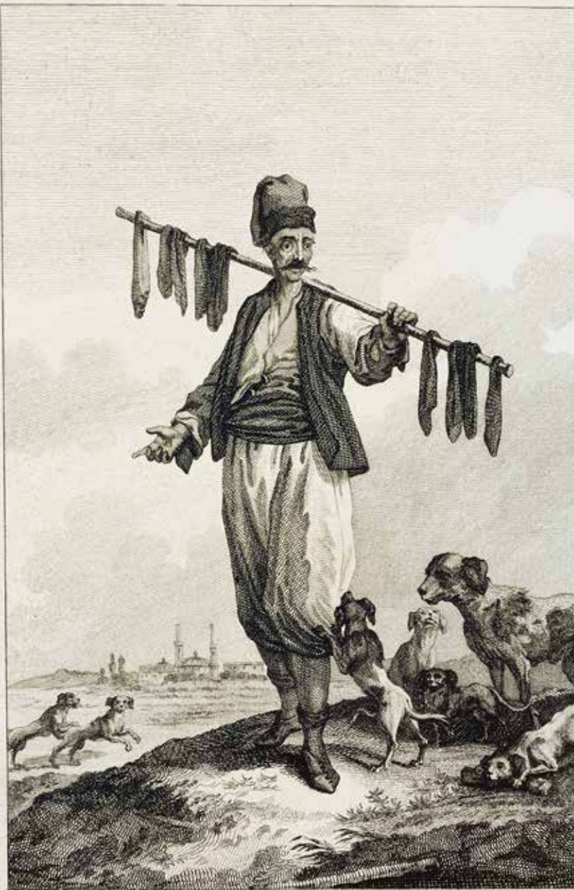
Le Djeguerdji ou Marchand de Foies.