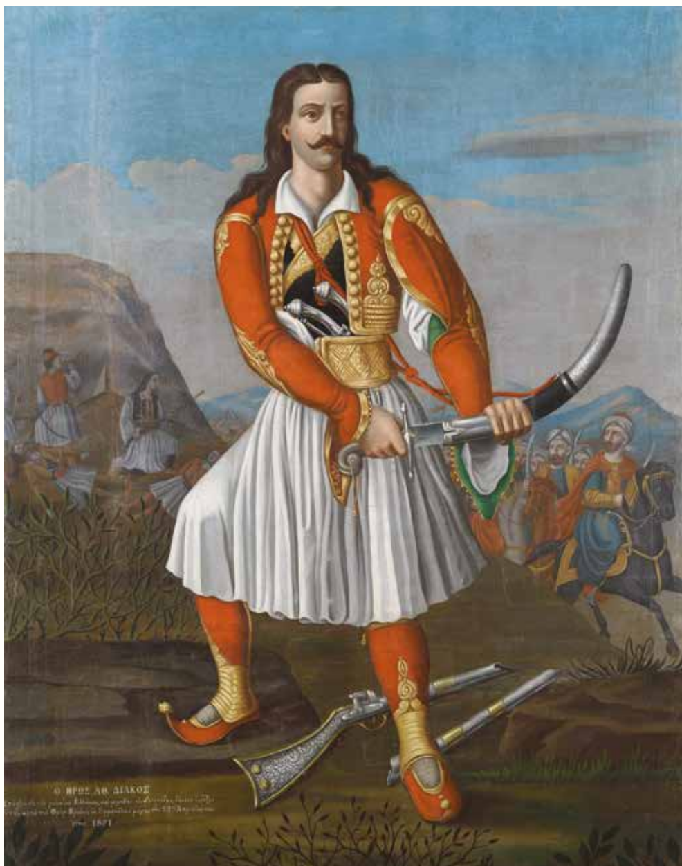
Κωστής Δεσύλλας ◊ Ο Αθανάσιος Διάκος ◊ Περ. 1870 ◊ Λάδι σε μουσαμά, 154×117 εκ. ◊ Μουσείο Μπενάκη 32926, αποκτήθηκε με τη συνδρομή του Ιδρύματος Ιωάννου Φ. Κωστοπούλου

ΠΑΡΑΛΕΙΠΟΝΤΑΙ ΕΝΔΙΑΜΕΣΕΣ ΣΕΛΙΔΕΣ IN-BETWEEN PAGES ARE OMITTED