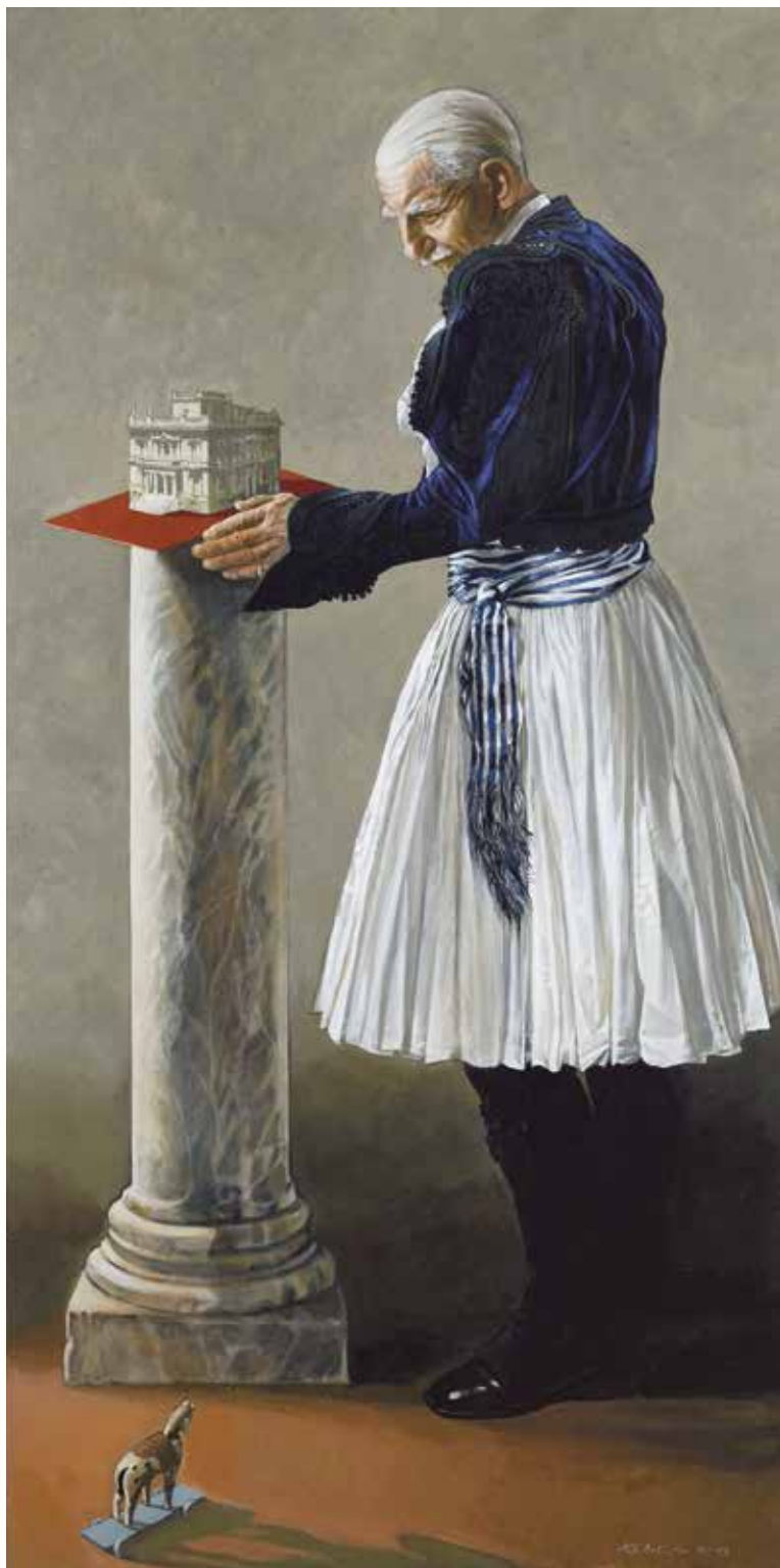
Αλέκος Λεβίδης (γενν. 1944) ◊ Αντώνης Μπενάκης ◊ Λάδι σε μουσαμά, 200x100 εκ. ◊ Μουσείο Μπενάκη ΓΕ 39132