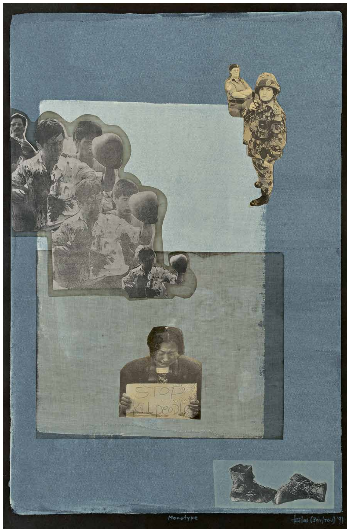
Πόλεμος, 1991 Μικτή τεχνική σε χαρτί, μονοτυπία, 80 x 52 εκ.