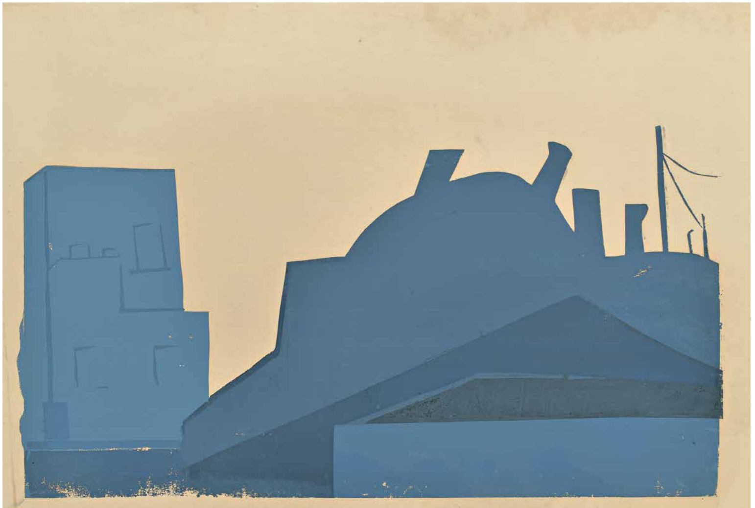
Σπουδή, 1960–65 Χειροποίητη μεταξοτυπία, 42 x 65 εκ.

Study , 1960–65 Handmade silkscreen print, 42 x 65 cm